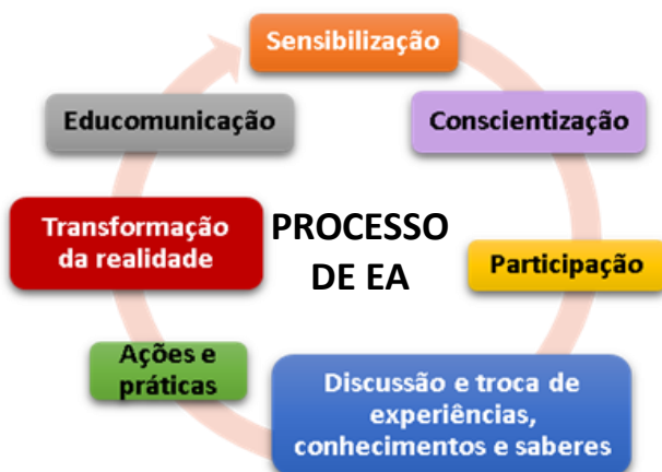
Figura 1 – Processo da Educação Ambiental (EA)