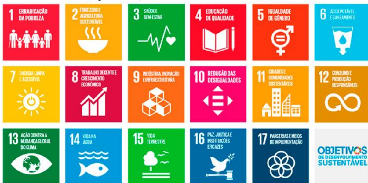
Figura 2 - Objetivos de Desenvolvimento Sustentável

Assim como o Plano de Gestão Ambiental, o Plano de Educação Ambiental para as ações do quadriênio de 2021-2024 se baseou nos 17 Objetivos de Desenvolvimento Sustentável (ODS), Figura 2. Estes objetivos foram adotados em 2015 a partir da reunião de chefes de Estado e de Governo na sede da Organização das Nações Unidas, em Nova York. Foi uma decisão histórica dos países-membros da ONU para unir forças em prol de uma Agenda Mundial de Desenvolvimento Sustentável, que deve ser cumprida até o ano de 2030.