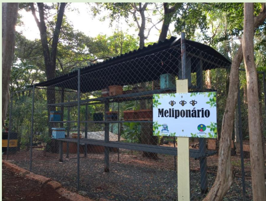
Fotografia 3 - Meliponário

Destaca-se o seu meliponário que tem como objetivo proteger e reproduzir espécies nativas de Abelha Sem Ferrão (ASF), como: Marmelada, Iraí, Jataí, Mirim plebeia, Mirim droriana, Benjoi, Manduri, Mandaguari amarela. Além do meliponário, o Horto possui abelhas oriundas de resgates, relacionados a corte de árvores, sendo as ASF Borá e Jataí. Ocorre de forma natural, dentro dos blocos de concreto dos canteiros do Horto a espécie Iraí.