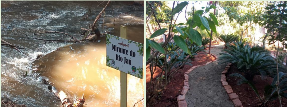
Fotografia 5 – Rio Jaú (à esquerda) e a Trilha dos Sentidos (à direita)