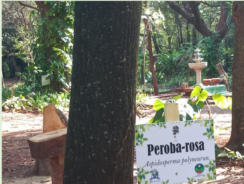
Fotografia 2 – Tronco da Peroba-rosa

Destaca-se o seu meliponário que tem como objetivo proteger e reproduzir espécies nativas de Abelha Sem Ferrão (ASF), como: Marmelada, Iraí, Jataí, Mirim plebeia, Mirim droriana, Benjoi, Manduri, Mandaguari amarela. Além do meliponário, o Horto possui abelhas oriundas de resgates, relacionados a corte de árvores, sendo as ASF Borá e Jataí. Ocorre de forma natural, dentro dos blocos de concreto dos canteiros do Horto a espécie Iraí.