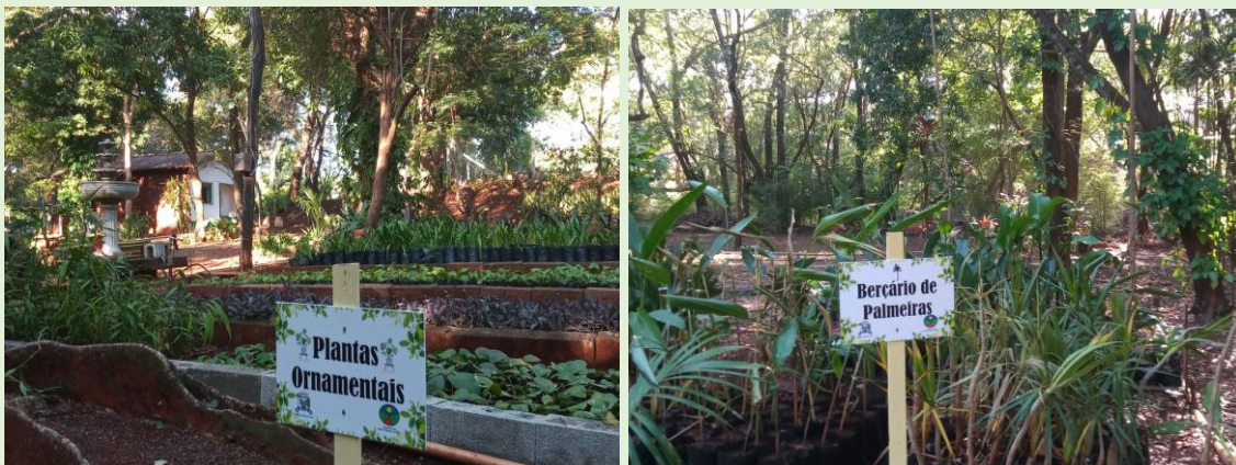
Fotografia 1 - Mudas

mudas produzidas servem a recuperação de áreas degradadas, arborização urbana, revitalização e manutenção de jardins públicos e áreas verdes e centro de capacitação e Educação Ambiental. Outro aspecto relevante é a crescente conscientização do público sobre a destruição e degradação das florestas, fator que também tem levado ao estabelecimento de um grande número de ações voltadas a assegurar a sustentabilidade ambiental do manejo a ser adotado.