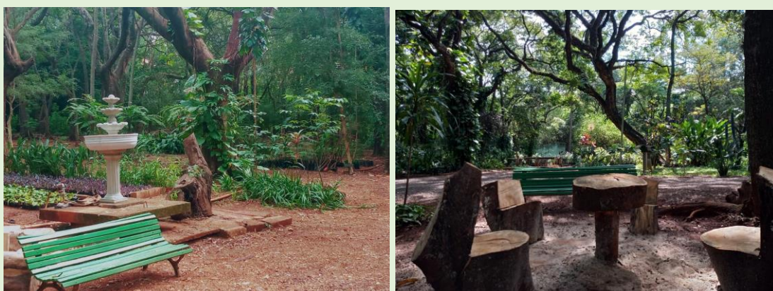
Fotografia 4 – Exemplos de infraestrutura