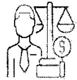
S.E.F. Secretaria de Economia e Finanças

serviços anexa à Lei Complementar 515/2017, forem prestados sob a forma de Sociedades Uniprofissionais, o ISS será recolhido mediante a multiplicação do valor fixo anual pelo número de cada profissional habilitado, sócio, empregado ou não, que preste serviços em nome da sociedade.