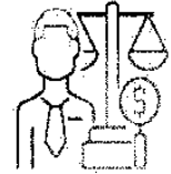
S.E.F. Secretaria de Economia e Finanças

PREFEITURA DO MUNICÍPIO DE JAHU "Fundada em 15 de agosto de 1853" SECRETARIA DE ECONOMIA E FINANÇAS Rua Paissandu, 444 – Centro – Jahu/SP Telefone: (14) 3602-1742